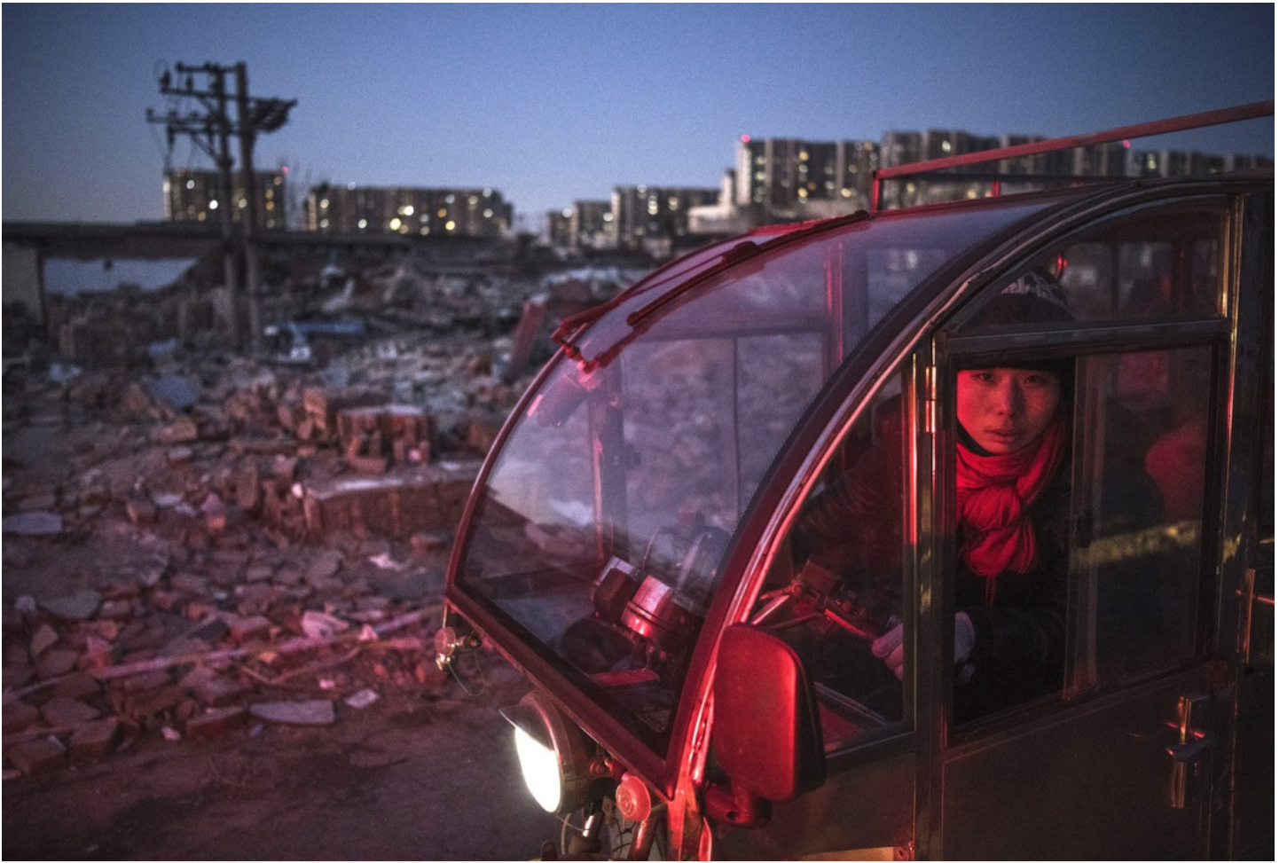
2017年12月，北京的清理「低端人口」現場。