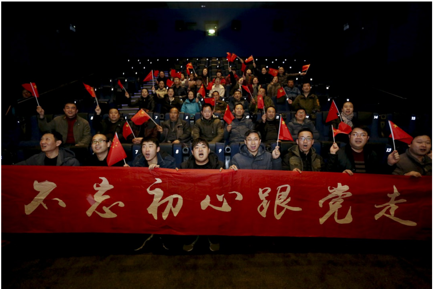
2018年3月，紀錄片《厲害了 我的國》的其中一個放映現場。