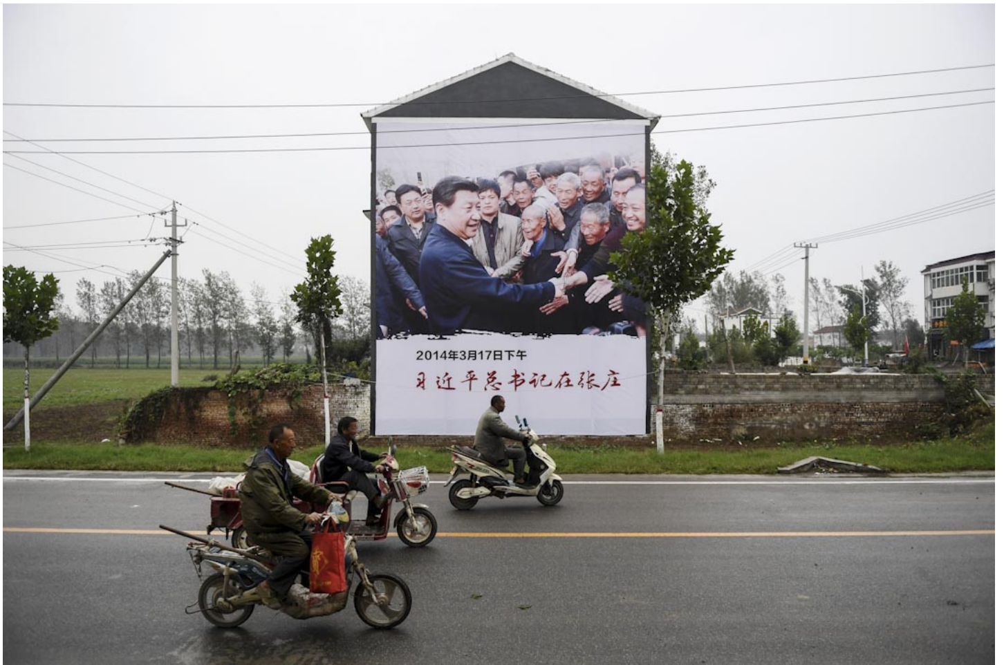
2017年9月28日，中國河南一幅巨型的廣告牌，內容是習近平到訪河南一條村莊時，受到村民歡迎的圖片。