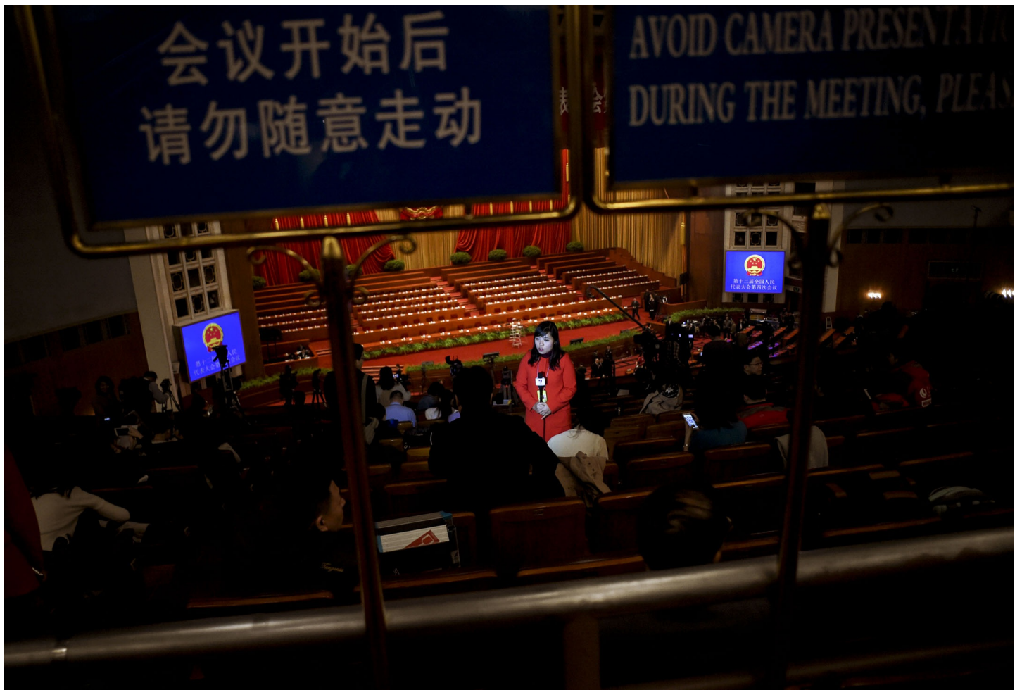
2018年，在非政府組織「無國界記者」（RSF）公布的全球新聞自由指數中，總共180個受調查的國家和地區裏，中國大陸繼續位列榜單第176名，保持全球倒數第五。