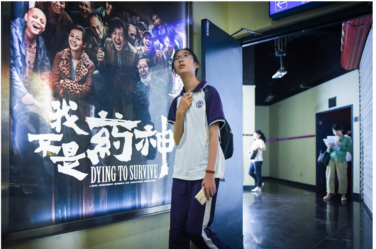
2018年7月，電影《我不是藥神》上映。